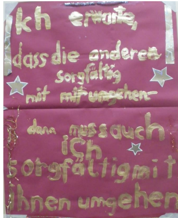
Bild: Schüler/innenarbeiten, VS Liebenau, Graz.