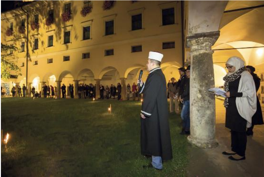
Bild: Friedensgebet der Religionen im Kreuzgang des Minoritenklosters, Graz, Oktober 2014