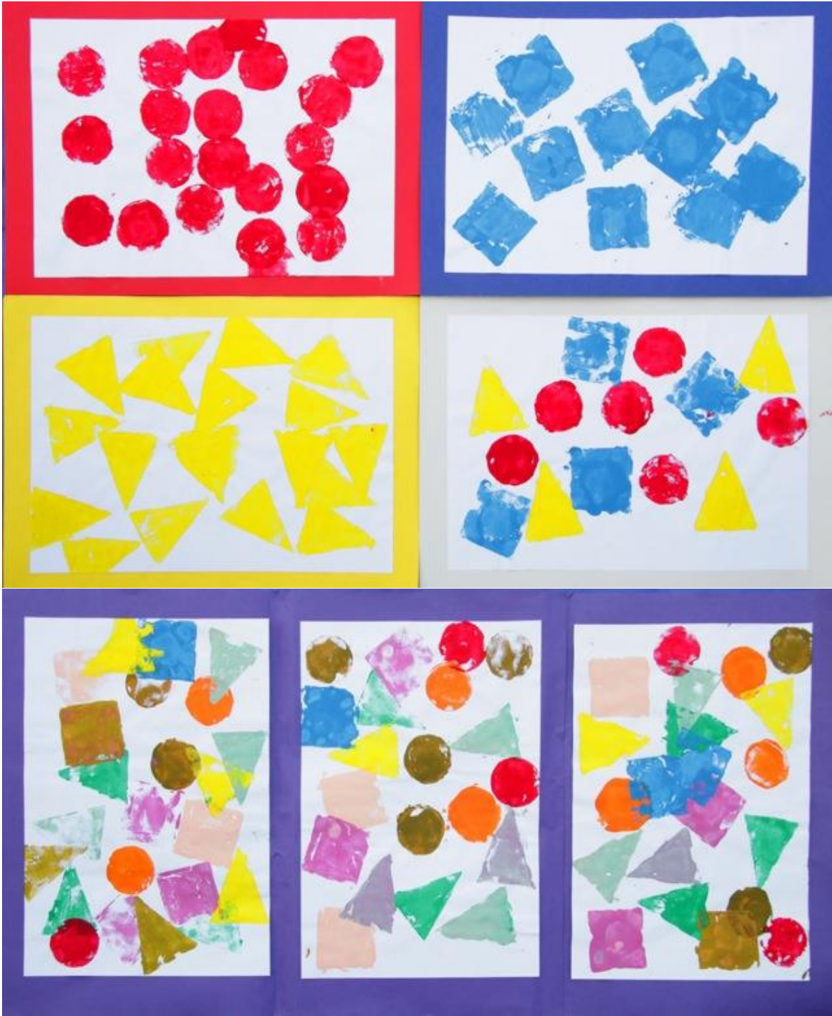
Schüler/innenarbeit, Graz-VS Punitgam.